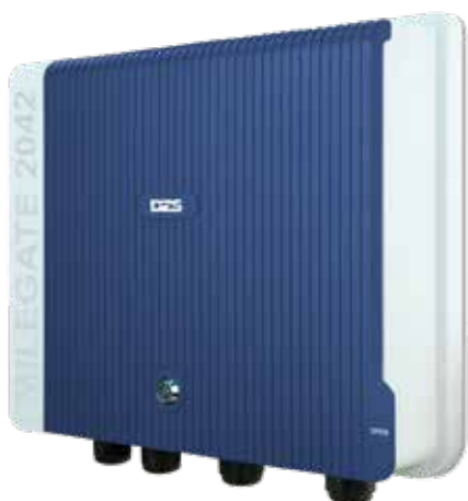
MileGate 2042 G.fast-DPU (Distribution Point Unit)

Distribution Point Units (DPU) für ultra-breitbandige FTTB-Applikationen mit G.fast bis 212 MHz